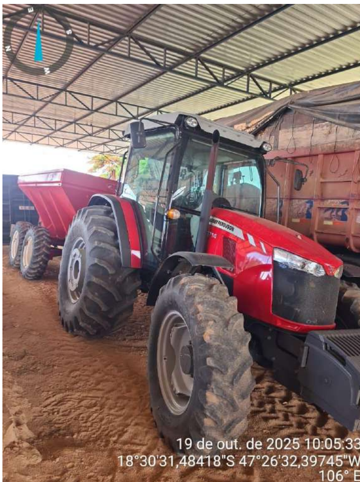
Distribuidor de calcário em questão (ao fundo, acoplado no trator)

Referência de mercado: Elementos 11 e 12 da pesquisa de mercado (Anexo I). O VM estabelecido é proveniente da média aritmética dos elementos citados.