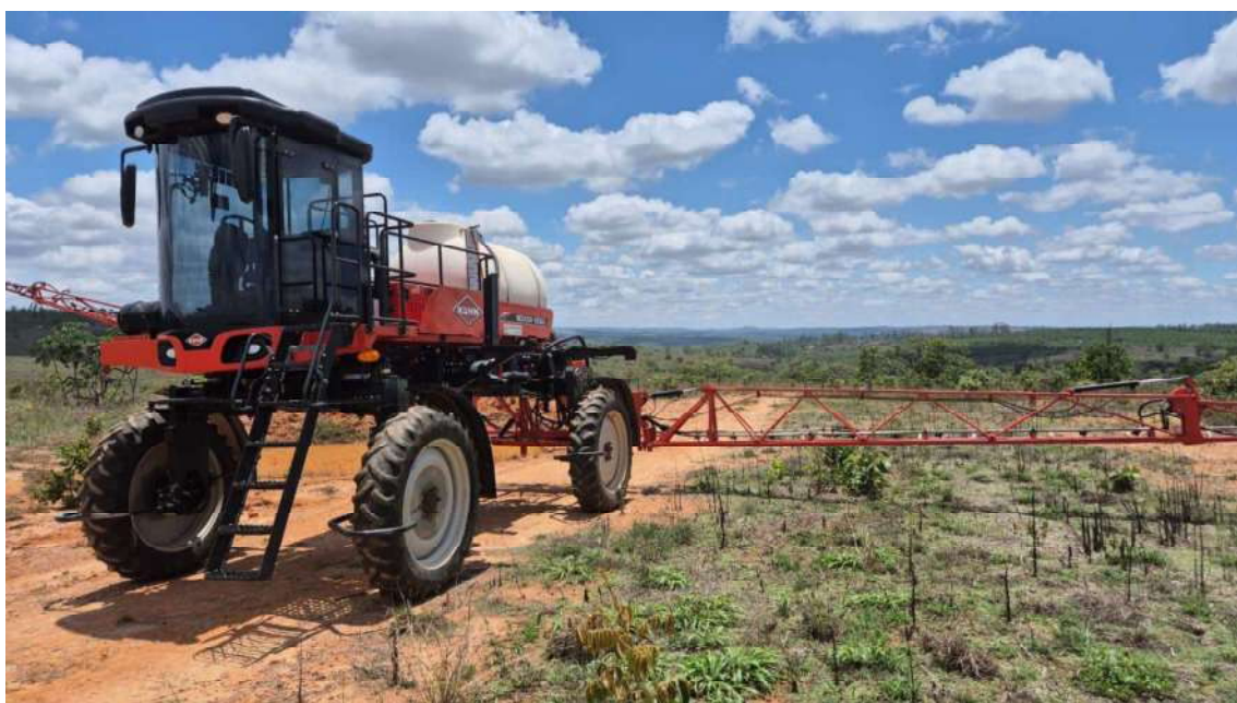
Aplicando Herbicida em 10/11/2025.

No vetor econômico-financeiro, os Recuperandos mantêm instrumentos de mitigação de risco e de suporte de capital de giro compatíveis com a fase do ciclo produtivo, incluindo contratos a termo e/ou Bater, CPRs vinculadas à colheita e logísticas para escoamento e armazenagem. Portanto, indispensável a manutenção da essencialidade dos bens e serviços diretamente afetos à produção e colheita, bem como, a preservação das condições operacionais