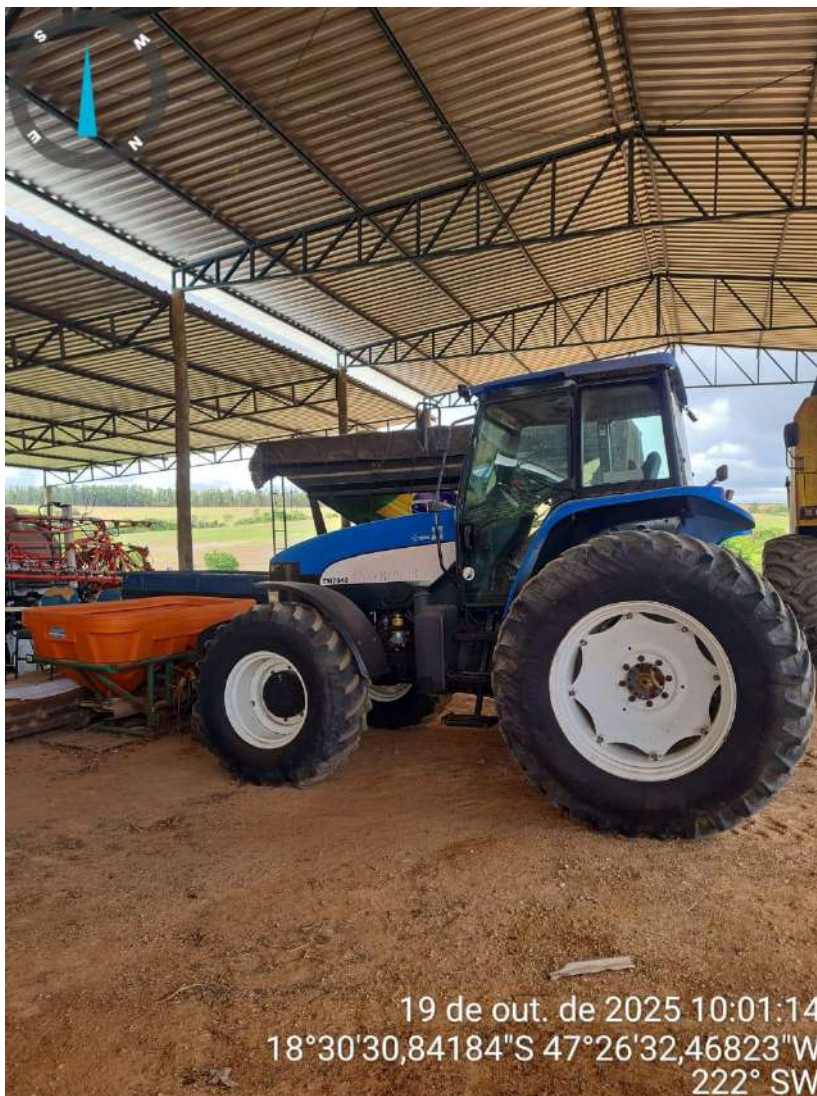
Distribuidor de fertilizantes em questão (em frente a trator)

Referência de mercado: Elementos 13 e 14 da pesquisa de mercado (Anexo I). O VM estabelecido é proveniente da média aritmética dos elementos citados.