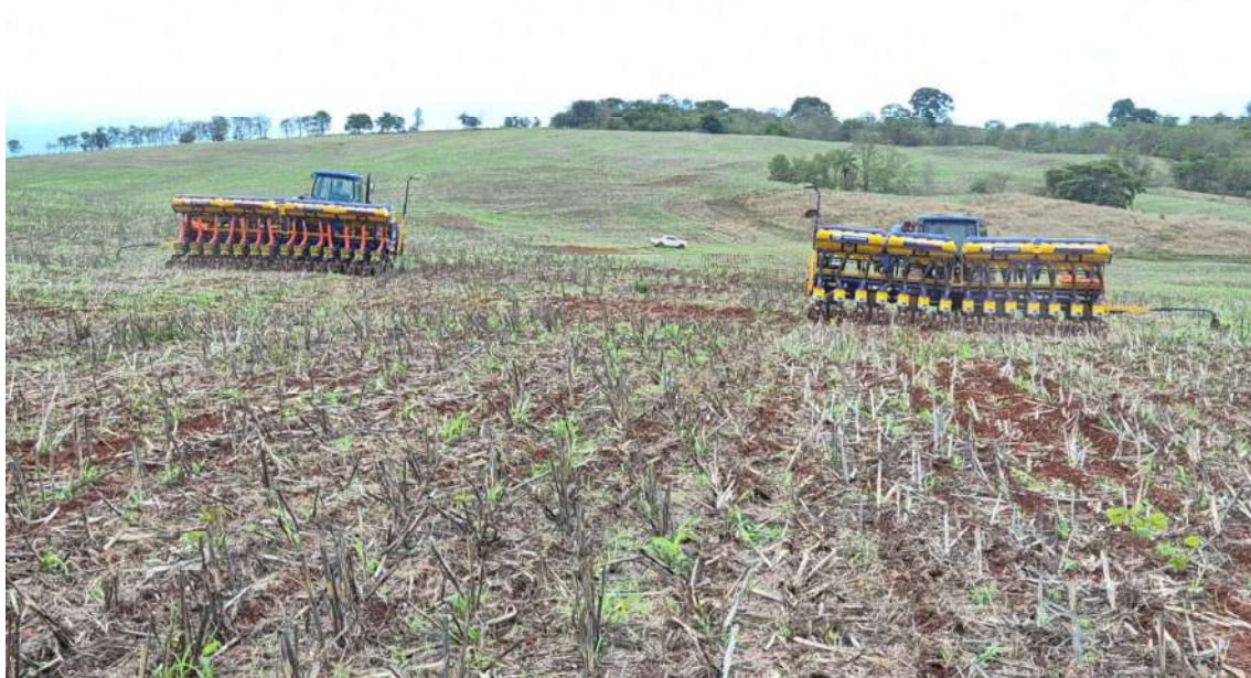
Fotos do plantio ocorrendo em 09/11/2025.