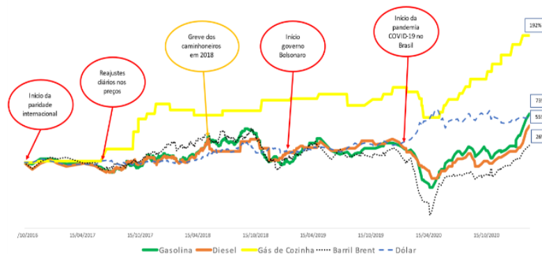
GRÁFICO 2 Variação dos preços da gasolina, diesel e gás de cozinha nas refinarias da Petrobras e comparação com preços do barril (brent) e câmbio (US$ x R$) 15 outubro de 2016 a 2 de março de 2021

55. No gráfico acima, verificamos outra importante questão e que causou a derrocada de muitas empresas transportadoras neste período: aumento do preço do diesel. Motivo para a forte greve dos caminhoneiros em maio de 2018, o produto tem hoje valor superior ao mais alto custo registrado naquele momento. Não é à toa que uma das maiores pressões atuais sobre esta política de reajustes da Petrobras provem desta categoria profissional.